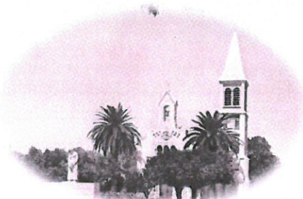
L'église de l'Alma en Algérie